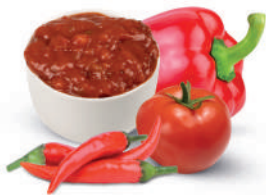
SALSA MEXICANA- SAUCE