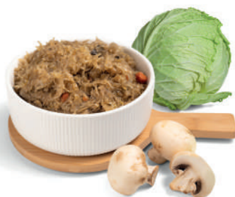
KOHL- UND PILZFÜLLUNG (MILD UND PIKANT)