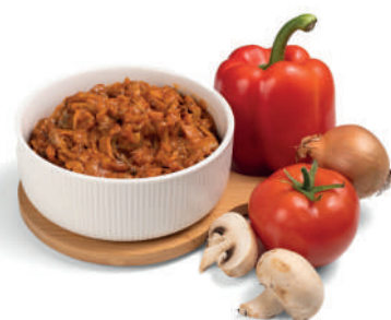
PILZFÜLLUNG MIT GEMÜSE