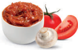
LECSÓ - UNGARISCHE GEMÜSE-PILZ- TOMATEN-SAUCE