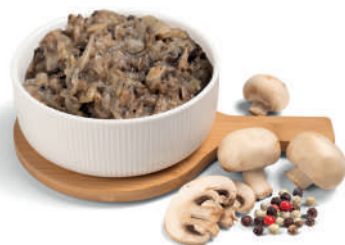
EXTRA-PILZFÜLLUNG – PILZFÜLLUNG MIT GEWÜRZEN