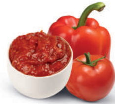
ADJIKA - PAPRIKA- TOMATEN-SAUCE