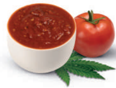
TOMATEN-KRÄUTER- -SAUCE MIT HANFSAMEN