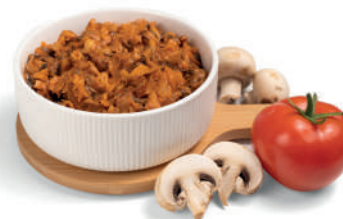
PILZ- UND TOMATENFÜLLUNG