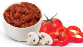
UNGARISCHE SOÙE - TOMATENSOÙE MIT PAPRIKA UND PILZEN