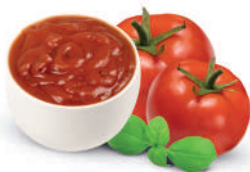
KRÄUTERSAUCE FÜR PIZZA