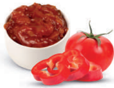
ZIGEUNERSAUCE - PFEFFER- UND TOMA- TENSAUCE