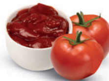
CATERING-KETCHUP - TOMATENSAUCE (MILD UND PIKANT)